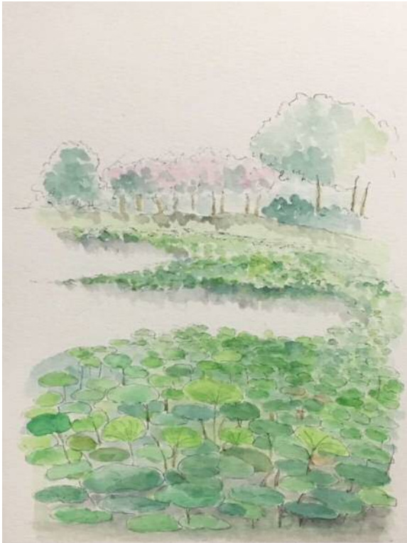
大池の蓮は夏も元気一杯です！

気持ちのいいオープンスペースにある大きなテントやソファでくつろげます。インスタ映え間違いなしです。まるで海辺にいるように風を感じながらのビールは最高です。