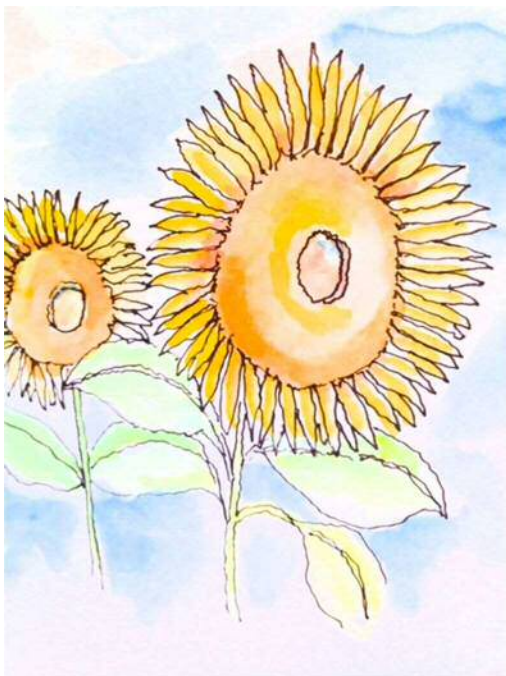
太陽が眩しい向日葵たち

一番のお気に入りには、風車の広場です。風車の下の花壇は、春になるとチューリップ、夏になると向日葵、秋になるとコスモスが綺麗に咲きます。いつ行っても、まるで外国にいるような気分を味わえます。