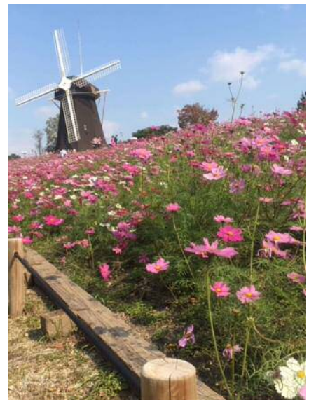
秋の風車広場（花はコスモスです）