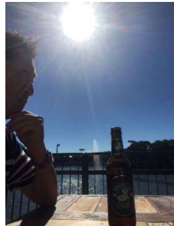
ドイツビールで乾杯！！